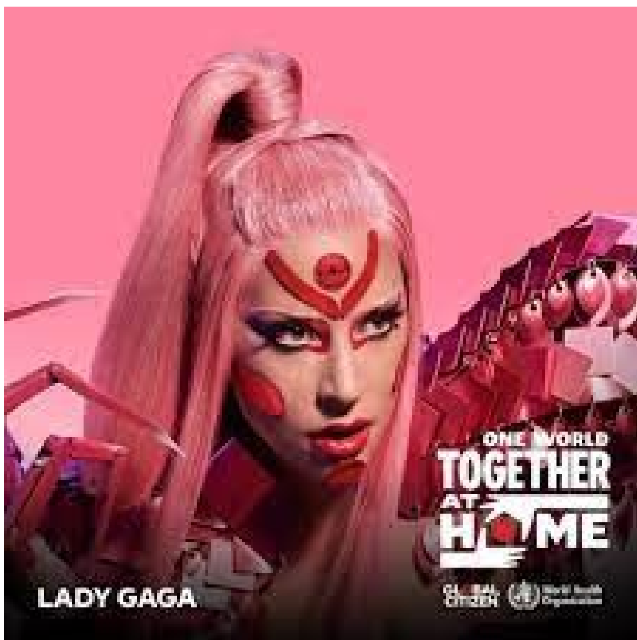
Lady Gaga in uno dei Poster del Concerto "C-19"

Ma veniamo ora -sempre più in tema col titolo del qui presente Saggio- al famoso Concerto Virtuale della Prima Segregazione da "C-19" , emblematicamente denominato: " One World: Together at Home ", concerto organizzato il 18 aprile 2020... proprio dalla nostra zelante Lady "Lupus in Fabula" Gaga (e, ovviamente, da...' CHI ' sta dietro di lei).